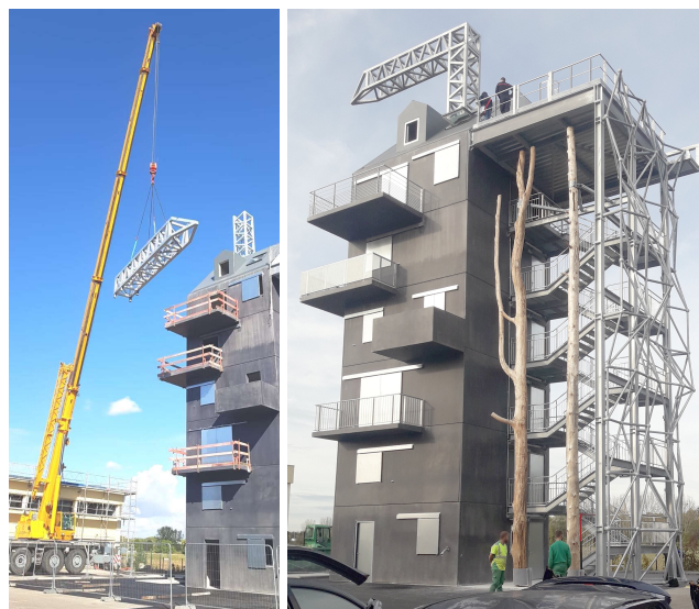
Tour d'entraînement SDIS 67 – Maîtrise d'œuvre groupe Projex

Le SDIS (Service Département d'Incendie et de Secours) du Bas-Rhin a choisi de s'équiper d'un outil polyvalent pour entraîner le GRIMP (Groupement d'Intervention en Milieu Périlleux) à circuler en sécurité dans des environnements variés. Cette tour d'exercice installée sur le site d'Illkirch-Graffenstaden comporte notamment un mur treillis d'escalade et une grue treillis équipée d'une tyrolienne culminant à plus de 26m de hauteur. Deux troncs d'arbre ont même été installés pour simuler des interventions en milieu forestier !